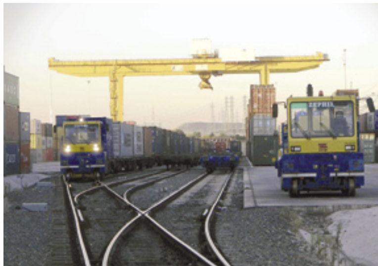
La situación en el resto de países europeos es mejor que en España